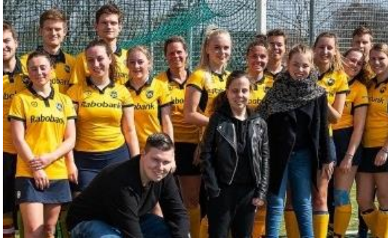
Afbeelding: Drie mogelijke MUS bewoners te midden van de hockeyclub dames en heren van Leerdam

Een slogan ontstaan na een brainstormsessie van de pr- communicatiegroep tijdens de tweede bijeenkomst van 17 april jl. Meer hierover leest je verderop in deze nieuwsbrief!